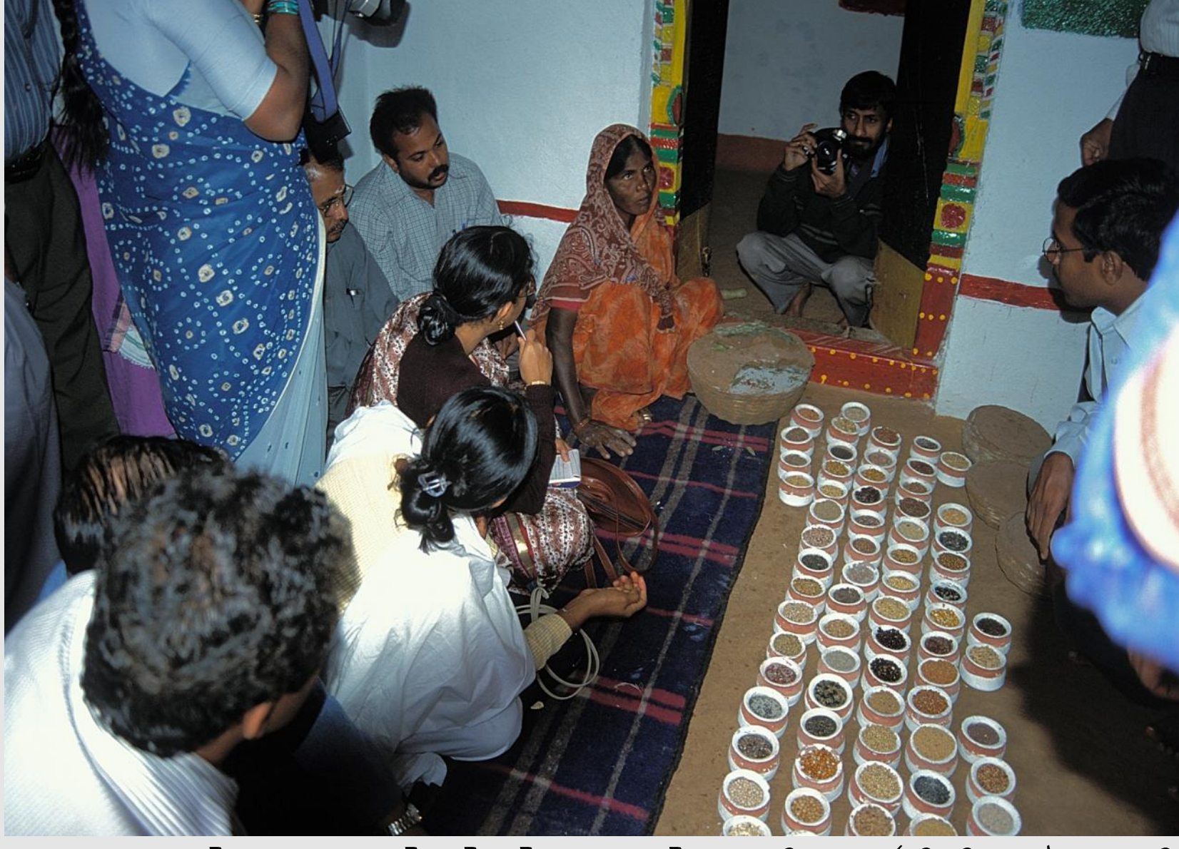
ऊपर: डेक्कन डेवलेपमेंट सोसायटी (डीडीएस) की महिलाओं द्वारा सुरक्षित रखे जा रहे बीजों की विविधता।