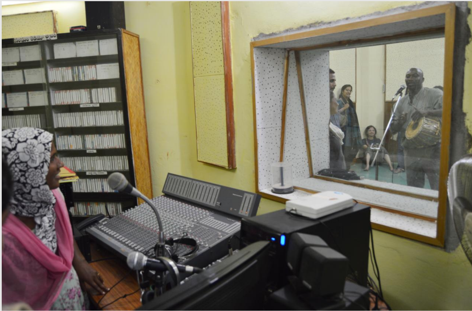
ऊपर : कम्युनिटी रेडियो के जरिए अधिक से अधिक लोगों तक पहुंचना डीडीएस के कार्यक्रमों का हिस्सा रहा है।