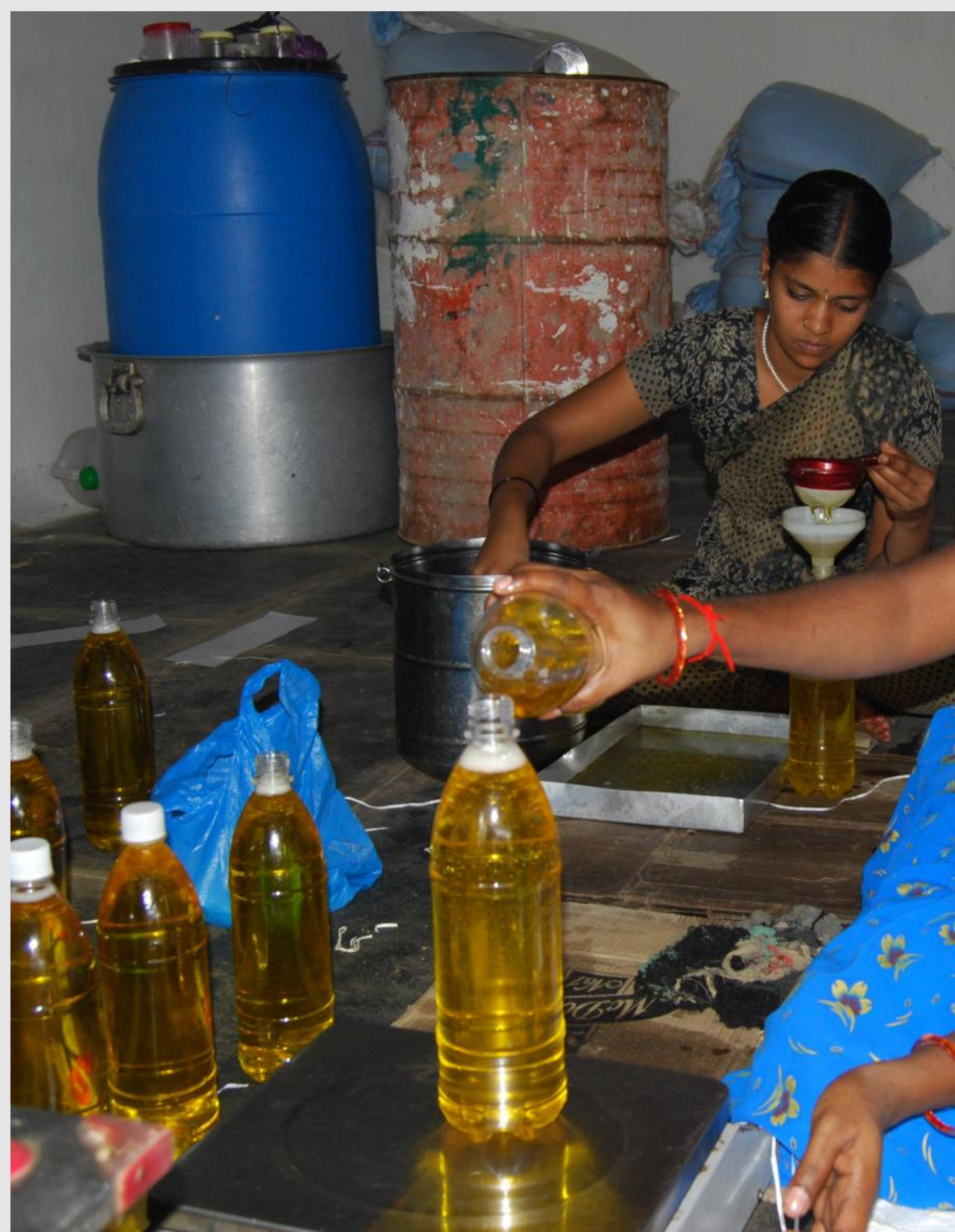
जैविक मूंगफली तेल की बॉटलिंग के लिए टिम्बकटू कलेक्टिव द्वारा शुरु की गई इकाई।