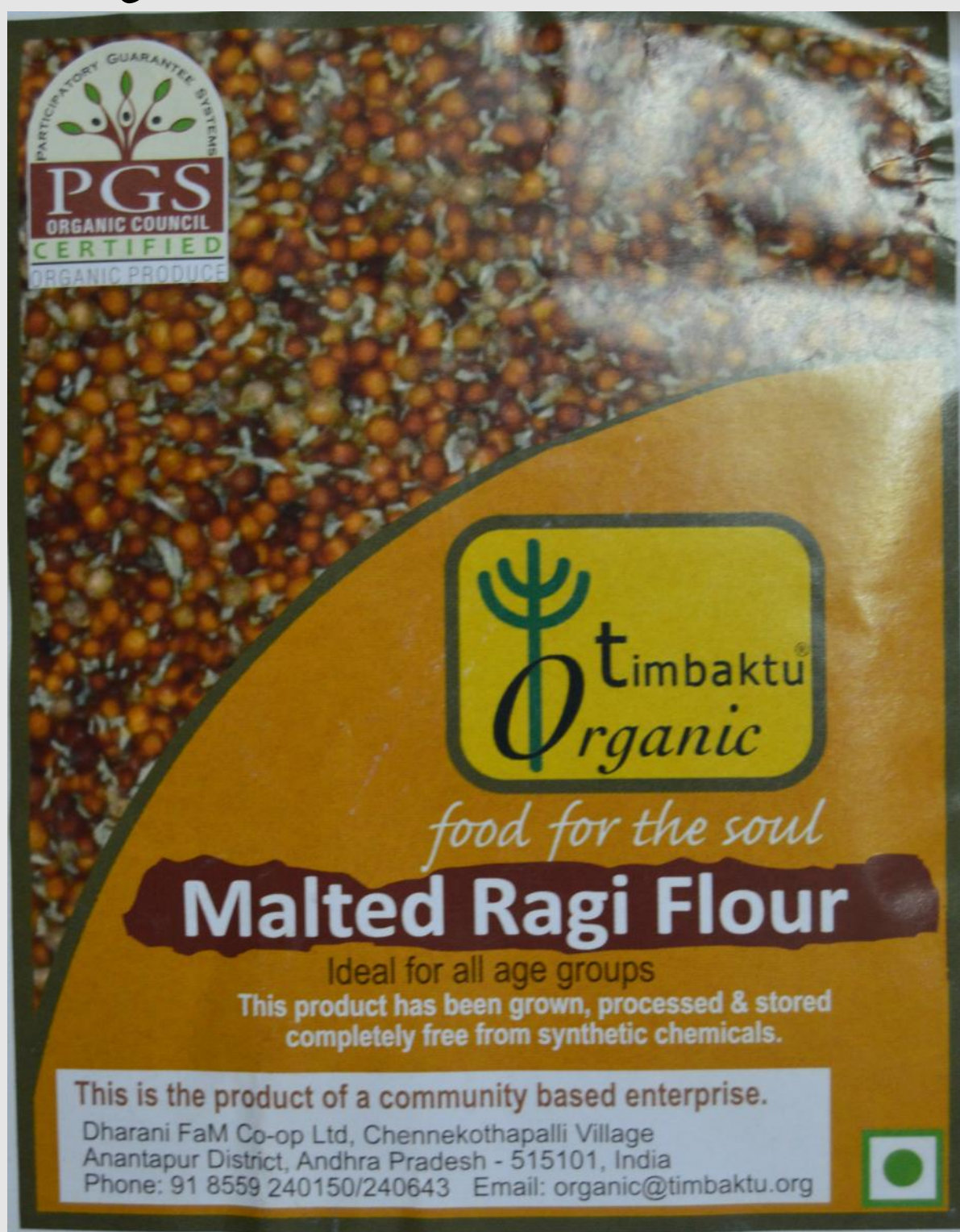
रागी आंध्र प्रदेश के सूखाग्रस्त इलाकों में एक महत्वपूर्ण अनाज है।