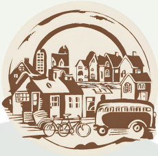
അധിവാസ സമലങ്ങളും ഗതാഗതവും