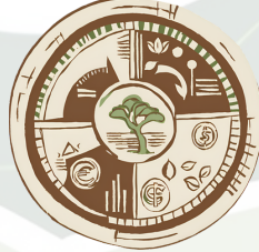
ബദൽ സമ്പദ്ഘടനകളും സാങ്കേതികവിദ്യകളും