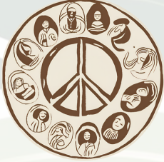
സമൂഹം, സംസ്കാരം, സമാധാനം