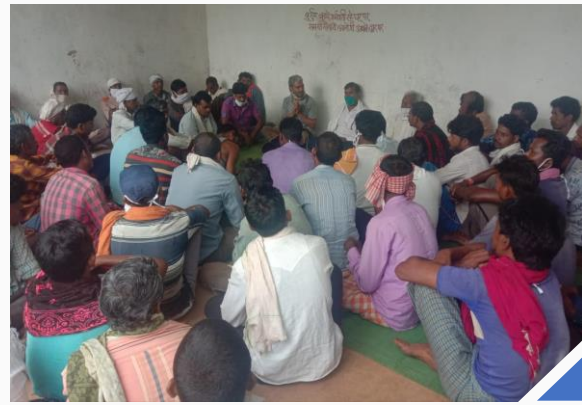
(ડા) વન તરફ જઈ રહેલી બેંગા મહિલાઓ; (જ) ગ્રામદૂત કાર્યક્રમ અભિયાનની મીટિંગ અને બેંગા ગ્રામસભા

બેંગા ચક્કા, ગાઢ જંગલોનો એક વિસ્તાર, જ્યાં મુખ્યત્વે બેંગા લોકો રહે છે ખાસ કરીને વંચિત આદિવાસી જૂથ (વલ્નરેબલ ટ્રાઈબલ ગ્રુપ-પીવીટીજ). ઉમરીઆ અને ડીડોરી જિલ્લામાં લગભગ ૭૦ જેટલા ગામો છે જે આ વન્ય પટ્ટાનો હિસ્સો છે. ૨૦૦૮ થી, ગ્રામદૂત કાર્યક્રમ અને જંગલ અધ્યયન મંડલ નામના બે અભિયાન જે અધિકાર-આધારિત સજાગતા કેળવવા માટે કાર્યરત છે તેમના સહકારથી સમુદાયો વન્ય અધિકારોની માન્યતા મેળવવાની દિશામાં કામ કરી રહ્યા છે. અભિયાનના પ્રારંભિક વર્ષોમાં, વ્યક્તિગત વન્ય અધિકારોને માન્યતા પ્રાપ્ત થઈ હતી, ૨૦૧૭ થી આ અભિયાને સીએફઆરને કાયદાકીય માન્યતા અપાવવા અંગે ધ્યાન કેન્દ્રિત કર્યું છે. હાલમાં, ડીડોરી તાલુકાની ૧૦ ગ્રામ સભાઓએ સીએફઆર દાવો કરવા માટે તેમના દસ્તાવેજો અને પુરાવા તૈયાર રાખ્યા છે. જ્યારે લોકડાઉનની જાહેરાત થઈ ત્યારે આ ગ્રામ સભાઓ સીએફઆરની પ્રક્રિયાને આગળ વધારવા માટે આ દસ્તાવેજો જમા કરાવવાની તૈયારીમાં જ હતી.