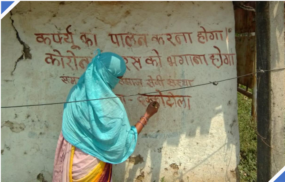
એક આદિવાસી મહિલા કોરોના વાઈરસ અને સામાજિક અંતર અંગે સજાગતા કેળવતા ભીતસૂત્રો દોરે છે.

વન્ય પેદાશોનું એકત્રીકરણ અને ખાદ્યપદાર્થોના વિતરણ બંને પ્રવૃત્તિ દરમિયાન એ વાતની કાળજી રાખવી જરૂરી હતી કે સમુદાયોને ચેપ લાગવાની શક્યતાઓથી બચાવી શકાય. ગ્રામ સભાઓએ ભીડ એકઠી થતી અટકાવવા માટે જાહેર વિતરણ કેન્દ્રો પર ખાદ્ય વિતરણ કરવાની મનાઈ ફરમાવી હતી. તેની જગ્યાએ, તેમણે દરેક વ્યક્તિના ઘરના દરવાજે ખાદ્યપદાર્થો પહોંચાડવાનું નક્કી કર્યું હતું, જેના માટે તેમણે ગ્રામ પંચાયતની મદદ લીધી હતી, આ પદાર્થોને ૪૮ કલાક માટે સૂર્યપ્રકાશમાં રાખ્યા પછી જ તેનું વિતરણ કરવામાં આવતું હતું. ખાદ્યપદાર્થ વિતરણની કામગીરી શરૂ કરતા પૂર્વે, કોવીડ-૧૯ વિશે સજાગતા કેળવવા માટે, ગ્રામ પંચાયતોને જાહેર સ્થળોએ આવેલી દીવાલો પર સ્વાસ્થ્ય સંબંધી માહિતી આપતા સૂત્રો લખાવવાની અને માહિતી લોકો સુધી પહોંચાડવા લાઉડસ્પીકરનો ઉપયોગ કરવાની સૂચના આપવામાં આવી હતી.