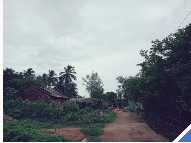
(ડા) નાથાપુરની ફરતે આવેલા ગાઢ જંગલો; (જ) નાથાપુર ગામનું ચિત્ર

નયાગઢ જિલ્લાના નાથાપુર ગામનો કોંધ આદિવાસી સમુદાય ઘણા દાયકાઓથી ટાંગી રેન્જ ફોરેસ્ટની સુરક્ષા કરી રહ્યો છે. વાસ્તવમાં, રાણપુર તાલુકામાં, મહિલાઓમાં જંગલોનું સંરક્ષણ કરવાની એક ખૂબ જ જૂની - લગભગ ૪૦ વર્ષ જેટલી જૂની પરંપરા છે. તેમ છતાં, તેમના સીએફઆર અધિકારોને કાયદાકીય રીતે માન્યતા પ્રાપ્ત થઈ નથી. ઘણા બધા લોકોમાં હવામાન પર તોળાઈ રહેલા સંકટ અંગે સભાનતા આવી એ પહેલા, નાથાપુર ગામના લોકોને જંગલોનું મહત્વ અને જંગલો તેમના જીવનમાં કેટલી મહત્વની ભૂમિકા ભજવે છે તે શરૂઆતથી જ સમજાઈ ગયું હતું.