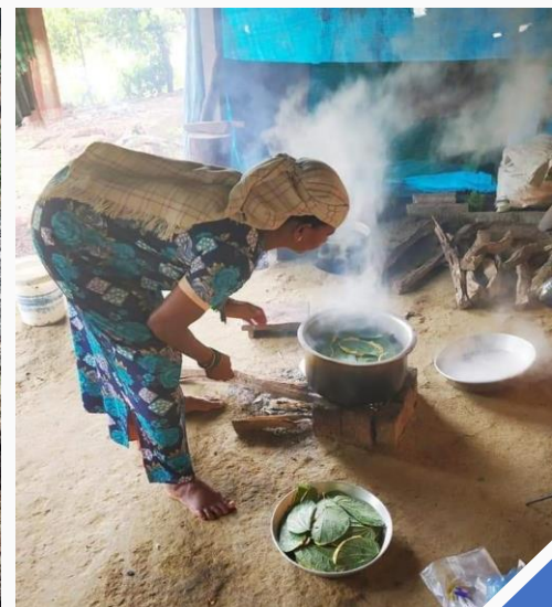
(ડા) સમુદાયો તેમના વનોનું સંરક્ષણ અને દરકાર કરે છે; (જ) વૈવિધ્યસભર વનપેદાશોનો ઉપયોગ કરીને ડિશ તૈયાર કરે છે