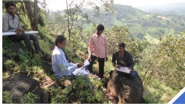
(ડા) આદિવાસી સમુદાયો તેમના સીએફઆર પ્રબંધન આયોજન તૈયાર કરે છે; (જ) સામુદાયિક વન સંસાધનોની માપણી

આ વાર્તા નર્મદા જિલ્લાના ડેડિયાપાડા તાલુકાના પૂર્વીય ભાગમાં સ્થિત ૨૪ ગામોના બનેલા એક ક્લસ્ટર વિશે છે. આ બધા ગામો આદિવાસી ગામો છે, જેમાં મુખ્યત્વે વસાવા જાતિના લોકો વસે છે, અને બે ગામોમાં તાડવી જાતિના કેટલાક પરિવારો છે. આ ગામો શૂળપાણેશ્વર અભયારણ્યનો પણ હિસ્સો છે, જેને ત્રણ તબક્કામાં - ૧૯૮૨, ૧૯૮૭ અને ૧૯૮૯ માં, ૬૧,૫૪૨.૪૦ હેક્ટર વન્ય જમીન પર અભયારણ્ય તરીકે જાહેર કરવામાં આવ્યું હતું, જેમાં કુલ ૧૦૪ ગામો આવેલા છે, જેમાં ૨૫ નિર્જન ગામોનો પણ સમાવેશ થાય છે. વન વિભાગ અને પેપર મિલ ફેક્ટરી દ્વારા ઘણા બધા દાયકાઓ સુધી સમુદાયો પર થયેલી હિંસાનો સામનો કર્યા બાદ, વન અધિકાર અધિનિયમ, ૨૦૦૬ અમલી કરવામાં આવ્યો હતો, જેના લીધે લોકોને બદલાવ આવવાની સંભાવનાઓ દેખાવાની શરૂઆત થઈ હતી. ૨૦૧૩-૧૪ માં, લાંબા ગાળાની લડત બાદ, આ ગ્રામ સભાઓને તેમના ગામોની કુલ ૧૯૨૨૦ હેક્ટર વન્ય જમીન માટે તમામ સીએફઆર દાવાઓ માટેના અધિકાર પત્રો મળ્યા હતા. ગુજરાતના ઘણા બધા જિલ્લાઓમાં થાય છે એનાથી વિપરીત, આ અધિકાર પત્રો વન અધિકાર અધિનિયમની તમામ શરતો અને નિયમોનું અવલોકન કરે છે. તેમને સીએફઆર અધિકાર પત્રો મળ્યા બાદ, ગ્રામ સભાએ ફરીથી નવી સામુદાયિક વન અધિકાર પ્રબંધન સમિતિઓ (સીએફઆરએમસી)ની ચૂંટણી કરી હતી, જે દરેકમાં ઓછામાં ઓછી એક તૃતિયાંશ જેટલી મહિલાઓ સભ્ય તરીકે ઉપસ્થિત હતી, અથવા જૂની સમિતિઓને સમર્થન આપીને ખરડા પસાર કર્યા હતા.