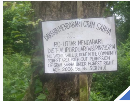
(ડા) કોડાલબસ્તીના પ્રવેશદ્વાર આગળ એક બોર્ડ, જે સામુદાયિક વન અધિકારોની ઘોષણા કરે છે!; (જ) દક્ષિણ મેંદાબારી સ્વઘોષિત સામુદાયિક વન અધિકારો

પશ્ચિમ બંગાળની સરકાર દ્વારા સીએફઆર હજુ સુધી અધિકૃત રીતે માન્યતા પ્રાપ્ત નથી, તેમ છતાં, આદિવાસી સમુદાયો- રવા, સંથાલ, ઓરેઓન, મેય અને કોચ તેમજ અન્ય વનમાં રહેતા વાન ટોંગ્યા સમુદાયો, જે પશ્ચિમ બંગાળના અલીપુરદુઆર જિલ્લામાં આવેલા જલદાપારા રાષ્ટ્રીય ઉદ્યાન અને બુક્ષા વાઘ અભયારણ્યની અંદર અને આસપાસ વસે છે, તેઓ ઘણા વર્ષોથી જંગલોનો લાભ પણ લે છે અને તેનું સંરક્ષણ પણ કરે છે.