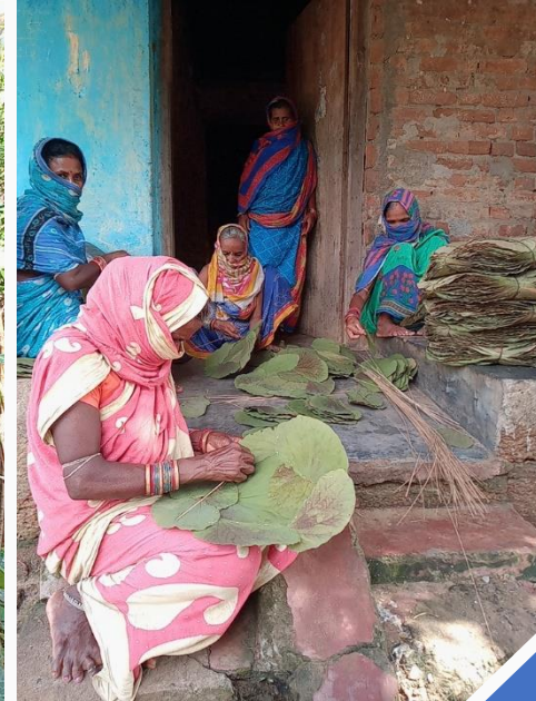
(ડ) તૈયાર કરવામાં આવેલ સિયાલી લીફ પ્લેટનું પ્રદર્શન; (જ) સિયાલી લીફ પ્લેટ બનાવતી મહિલાઓ