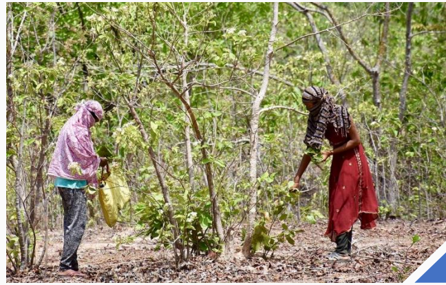
(ડા) તેંદુના પાનના બંડલ તૈયાર કરતા વનવાસીઓ; (જ) મહિલાઓ માર્ક પહેરીને અને સલામત સામાજિક અંતર જાળવીને એમએફપી એકત્રિત કરે છે

ગોંડીઆ જિલ્લામાં, ૭૫% વસતી આદિવાસીઓની છે, ખાસ કરીને ગોંડ અને હલબા આદિવાસીઓ. અહીં, ૨૫૦ થી વધારે ગામોના સીએફઆરને કાયદાકીય રીતે માન્યતા પ્રાપ્ત થયેલી છે, અને દેઓરી તાલુકામાં, ૨૯ ગામોએ તેમની ગૌણ વન્ય પેદાશોના સંગ્રહ અને વેચાણ માટે એક ફેડરેશનની રચના કરી છે. ફેડરેશન એક ચૂંટાયેલા માળખા તરીકે કામ કરે છે જે ગ્રામસભાને સહાય અને મદદ પ્રદાન કરે છે. તેનું સંચાલન બે પ્રતિનિધિઓ દ્વારા કરવામાં આવે છે (એક પ્રમુખ અને એક મંત્રી), જે તમામ ૨૯ ગામોમાંથી હોય છે. દર વર્ષે, ફેડરેશન એ બાબતની ખાતરી કરે છે કે આદિવાસીઓ અને સ્થાનિક વનવાસીઓને ઋતુ દરમિયાન તેમણે કરેલા તમામ ૧૧ દિવસના કામનું મહેનતાણું તેમને મળી રહે, વન વિભાગ જેવું નહીં કે જે તેંદુ એકત્રિત કરનાર પાસેથી તે ખરીદે અને તેમને માત્ર તેમની મજૂરીના ૨-૩ દિવસ માટેનું જ મહેનતાણું ચૂકવે. આ ઉપરાંત, વન વિભાગ, તેના વેપારીઓ દ્વારા, આ લોકોને પ્રતિદિન માત્ર રૂ. ૨૨૦ ચૂકવે છે અને માત્ર રૂ. ૨૫ જેટલું ઓછું બોનસ ચૂકવે છે, જ્યારે ફેડરેશન પ્રતિદિન રૂ. ૩૦૦ ચૂકવે છે અને ઋતુગત બોનસ રૂ. ૨૦૦ આપે છે.