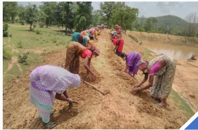
(ડા) મહુવાના ફૂલની ઉપજને સાફ કરતી મહિલાઓ; (જ) સમુદાય સલામત અંતર જાળવીને તેમનું સીએફઆર પ્રબંધન કાર્ય હાથ ધરે છે