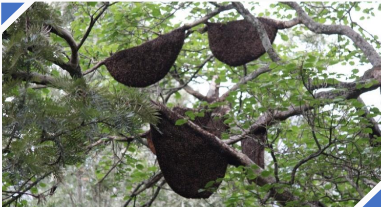
સોલીગા સમુદાયોએ લોકડાઉન દરમિયાન મધ પાડવાની કામગીરી કરી હતી

બીઆરટી ટાઈગર રીઝર્વના બાંગલે પોડુના કેથેગૌડાએ જણાવ્યું હતું કે: “સોલીગા સમુદાયો લગભગ ૨૮ પ્રકારની વન્ય પેદાશો (મધ, લીકેન, આમળા, સોપ નટ) અને અમારી અડધાથી વધારે આવક વન્ય પેદાશોમાંથી થાય છે. મારા સમુદાયના લોકો અને હું અમારા વપરાશ માટે કંદમૂળ, ફળો અને લીલા પાંદડા એકત્રિત કરવા માટે જંગલમાં ગયા હતા અને મધ પણ એકત્રિત કર્યું હતું જે અમે એલએએમપીએસને વેચી દીધું હતું. આ એલએએમપીએસ સોસાયટીઓની શરૂઆત કેટલાક દાયકાઓ પૂર્વે સરકાર દ્વારા કરવામાં આવી હતી અને હવે તેનું પ્રબંધન આદિવાસી સંઘો દ્વારા કરવામાં આવે છે, તે અમને મળતી મદદનો એક મહત્વનો સ્ત્રોત છે. એલએએમપીએસ સોસાયટીઓએ અમને અમારું અસ્તિત્વ ટકાવી રાખવા માટે મદદ કરી હતી અને સમગ્ર લોકડાઉનના સમયગાળા દરમિયાન આવક પ્રદાન કરી હતી.”