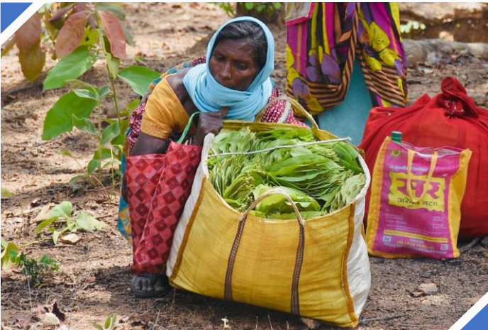
દિવસભરની તેંદુના પાનાની ઉપજ સાથે વનવાસી મહિલાઓ

આ વર્ષે લોકડાઉન દરમિયાન, ૨૯ ગામોના ફેડરેશને તેંદુના પાન વેચીને રૂ. ૨.૫ કરોડની આવક કરી હતી, જ્યારે તેમની જાતે જ તમામ પ્રબંધનો કર્યા હતા અને કોવીડ-૧૯ ન ફેલાય એ માટે સાવચેતીઓ પણ રાખી હતી. આ ઉપરાંત, ફેડરેશને ૨૦૧૭ માં તેંદુના પાનના વેચાણમાંથી જે નફો થયો હતો તેનો ઉપયોગ વરસાદી પાણીના સંગ્રહ માટે સરોવરો ખોદવાની મશીનરી ભાડે લેવા માટે કર્યો હતો. આ વિસ્તારોમાં ભૂગર્ભજળને પુનઃ જીવંત કરવામાં આવ્યા હતા અને આથી ગામલોકો ડાંગરની વાવણી પર પણ ધ્યાન આપી શક્યા હતા. જ્યારે વિદર્ભ નેચર કન્ઝર્વેશન સોસાયટી (વીએનસીએસ) નામની સ્વૈચ્છિક સંસ્થાના સભ્યો આ સમુદાયોને રાહત કીટ પ્રદાન કરવા માટે આવ્યા ત્યારે સમુદાયે તેમની આવકથી સંતોષ વ્યક્ત કર્યો અને આ કીટ સ્વીકારવાની ના પાડી.