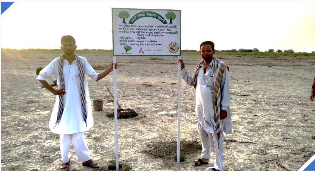
બન્ની ઘાસિયા મેદાનો સીએફઆર વિસ્તાર તરીકેની જાહેરાત કરતા સાઈન બોર્ડની નજીક ઉભેલા માલધારી પશુપાલકો

જાન્યુઆરી અને ફેબ્રુઆરી ૨૦૨૦ માં, ૧૫ ગામોમાં સીએફઆરએમસી તેમના સંરક્ષણ અને પ્રબંધન આયોજનો હાથ ધરવામાં વ્યસ્ત હતી, કારણ કે ચોમાસા પહેલાનો સમયગાળો ખૂબ જ મહત્વપૂર્ણ હોય છે. ખાસ કરીને, ગાંડા બાવળ (પ્રોસોપીસ જુલીફલોરા) દૂર કરવા માટે, જે એવો નુકસાનકારક છોડ છે જે ખૂબ જ ઝડપથી વધે છે અને સ્થાનિક ઘાસ અને વનસ્પતિનો નાશ કરે છે. શેરવો ગામમાં સીએફઆરએમસીએ ૨૦૦ હેક્ટર જમીન પરથી આ આક્રમક જાતને હટાવવા માટે મશીનનો ઉપયોગ કર્યો હતો, જ્યારે મિસરીયાડો ગામમાં, ૧૫૦ હેક્ટર જમીન પરથી આ છોડની આ આક્રમક જાતને નષ્ટ કરવામાં આવી હતી. જ્યારે લોકડાઉનની જાહેરાત થઈ ત્યારે, સીએફએમઆરસીને તેનું કામ અધવચ્ચે પડતુ મૂકવુ પડ્યુ હતુ.